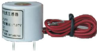
产品型号: JLPT01 额定电压50~300V(输入引线)