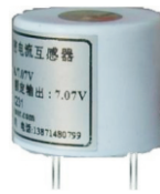
产品型号: JLPT02 额定电压50~300V