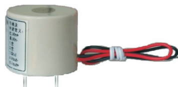
产品型号: JLPT03 额定电压50~500V(输入引线)