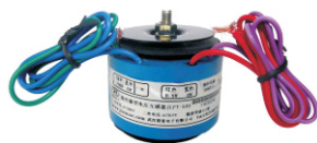
产品型号(单相): JLPT15 额定电压: 50~1000V