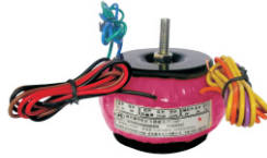
产品型号: JLPTN70 输入范围: AC0~700V